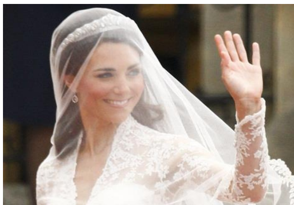
Gereed om afskeid te neem

Daar is verskeie profesieë in die Bybel waardeur Christene aangemoedig word om waaksaam en gereed te wees vir die skielike koms van die hemelse Bruidgom. Hierdie voorskrifte en vermanings moet ernstig opgeneem word, omdat daar so baie dinge is waardeur 'n gelowige se aandag afgetrek kan word van sy roeping om 'n dienskneg van Christus te wees. Ons moet met vrymoedigheid rekenskap van ons lewe kan gee wanneer ons Heer op 'n onverwagte uur terugkeer. Op daardie dag sal Hy sy bruidsgemeente na haar hemelse woning wegvoer, dan sal dit té laat wees om al die geestelike voorbereidings te tref om gereed en waardig te wees vir hierdie wonderlike afspraak.