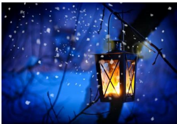
'n Skynende lig in 'n donker wêreld