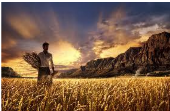
Besig om 'n oes in te samel

Skriflesing: "Pas op, waak en bid, want julle weet nie wanneer die tyd daar is nie. Dit is soos 'n man wat op reis is, wat sy huis agtergelaat en sy diensknegte volmag gegee het, en vir elkeen sy werk, en aan die deurwagter bevel gegee het om te waak. Waak dan, want julle weet nie wanneer die eienaar van die huis kom nie: in die aand of middernag of met die haangekraai of vroeg in die môre nie; dat hy nie miskien skielik kom en julle aan die slaap vind nie. En wat Ek vir julle sê, sê Ek vir almal: Waak!" (Mark. 13:33-37).