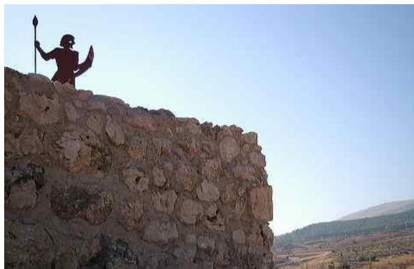
Waak teen die vyand se aanvalle