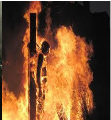
Monet kristityt maksoivat korkeimman hinnan uskostaan, usein mitä hirveimmillä tavoilla.

Tässä kirjeessä Herra Jeesus varoittaa, että seurakuntadispensaatiota ei pitäisi rinnastaa valtakuntatilanteeseen, koska me elämme maailmassa, joka on Pahan vallassa. Perkele on Kristuksen ja Hänen seurakuntansa suuri vastustaja ja se vaatii jäseniltä laaja-alaista hengellistä puolustusta. Kristuksessa perkele on kuitenkin voitettu vihollinen ja vaikka kristittyjen on kuoltava marttyyreina, heidän tulevaisuutensa on varma ja vakaa. Jeesus sanoo tässä kirjeessä: ”Älä pelkää sitä, mitä tulet kärsimään. Katso, perkele on heittävä muutamia teistä vankeuteen, että teidät pantaisiin koetukselle ja teidän on oltava ahdistuksessa kymmenen päivää. Ole uskollinen kuolemaan asti, niin minä annan sinulle elämän kruunun” (Ilm.. 2:10).