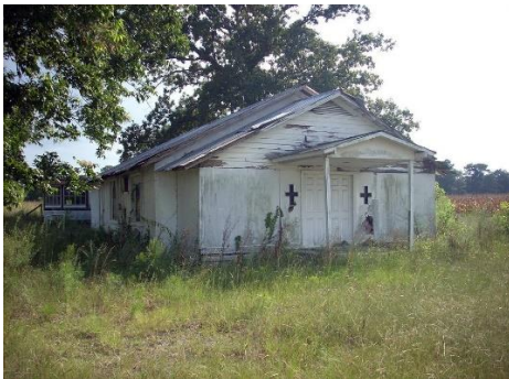
Ränsistynyt heinikon valtaama kirkko. Seurakunta lakkautettiin ja rakennus kävi tarpeettomaksi. Ylistyslauluja ei kuulu täältä.