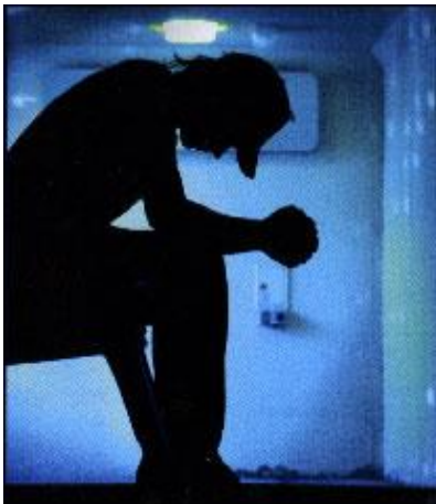
Lukemattomia kristittyjä vangittiin uskonsa tähden. Sitä tapahtuu edelleen.