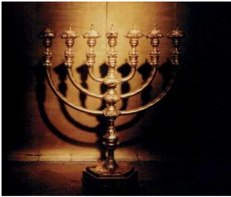
Kristuksen evankeliumin valo vahvistettiin Efeson seurakunnassa ja aluksi loisti kirkkaasti.