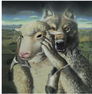
Möyhemmin väärät opettajat pujahtivat seurakuntaan ja pettivät uskovat (Apt. 20:28-30).