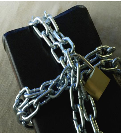
Voimakas vihamielisyys Raamatua kohtaan Jumalan Sanana on tunnusmerkillistä UT:n ajoille.