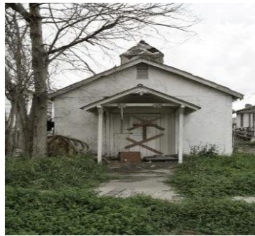
Autio kirkkorakennus viestien sanomaa, "likabod." Sisällä vain synkkä hiljaisuus.