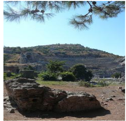
Lopulta seurakunta lopetti toimintansa ja kirkkorakennus raunioitui.

Efeson seurakunta aloitti hyvin Paavalin johdolla ja Kristuksen rakkaus sai ihmiset antamaan sydämensä Hänelle ja tulemaan kristillisen seurakunnan jäseniksi. Siellä julistettiin puhdasta kristinoppia kuten Paavalin kirje efesolaisille todistaa ja kaikki, mikä poikkesi siitä, hyljättiin. Lampunjalka ja öljy kuvaavat Pyhää Henkeä, joka loisti kirkkaasti ja ohjasi seurakuntaa kaikkeen totuuteen.