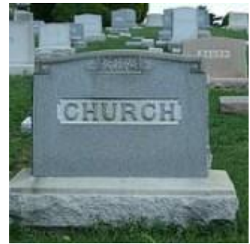
Uusia hautakiviä, jotka heijastavat menneitä päiviä, pystytetään tiheään kuolleiden seurakuntien hautausmailla.

Hengellisesti pysähtyneelle Sardeen seurakunnalle tarjotaan tilaisuus korjata, mikä on mennyt pieleen heidän hengellisessä elämässään ja uudelleen perustautua siihen totuuteen, jonka kuulivat alussa: “Näin sanoo hän, jolla on ne Jumalan seitsemän henkeä ja ne seitsemän tähteä: Minä tiedän sinun tekosi: sinulla on se nimi, että elät, mutta sinä olet kuollut. Heräjä valvomaan ja vahvista jäljellejääneitä, niitä, jotka ovat olleet kuolemaisillaan; sillä minä en ole havainnut sinun tekojasi täydellisiksi Jumalani edessä. Muista siis, mitä olet saanut ja kuullut ja ota siitä vaari ja tee parannus. Jos et valvo, niin minä tulen kuin varas, etkä sinä tiedä, millä hetkellä minä sinun päällesi tulen” (Ilm. 3:1-3).